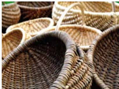
Młodzież i dorosłych Dom Narodowy zaprasza na warsztaty wplatania z wikliny.

Cieszyński Ośrodek Kultury Dom Narodowy i Stowarzyszenie Serfenta proponują wielkanocne świąteczne wplatanie z wikliny – czyli z żywej, pachnącej wierzby! Na kilkugodzinnych warsztatach pod okiem instruktorki rękodziela artystycznego wpleciemy najprawdziwsze wielka-