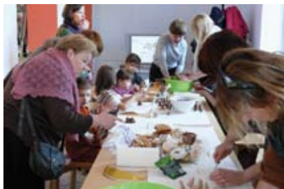
Wernisażowi wystawy „Babski dizajn” towarzyszyły warsztaty kulinarne.

Od kilku lat Zamek Cieszyn w marcu organizuje wystawy pod wspólnym szyldem: Babski dizajn. Tegorocznej odsłonie towarzyszy hasło „C'est la vie” czyli „Takie jest życie”, a symbolem wystawy jest kwitnący kaktus.