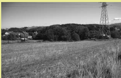
Nieruchomość przy ul. Zamarskiej przeznaczona do dzierżawy.

Burmistrz Miasta Cieszyna ogłasza ustny przetarg nieograniczony na wydzierżawienie na cel rolny nieruchomości Gminy Cieszyn.