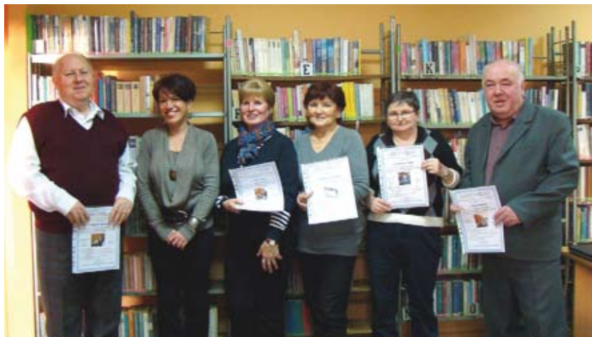
Kursantom z Biblioteki Miejskiej nieobce są już tajniki pracy z komputerem.

„Wszystko jest trudne, nim stanie się proste” - ta myśl autorstwa Margaret Fuller przyświecała kursantom podczas V kursu komputerowego organizowanego przez Filię nr 3 Biblioteki Miejskiej w Cieszynie.