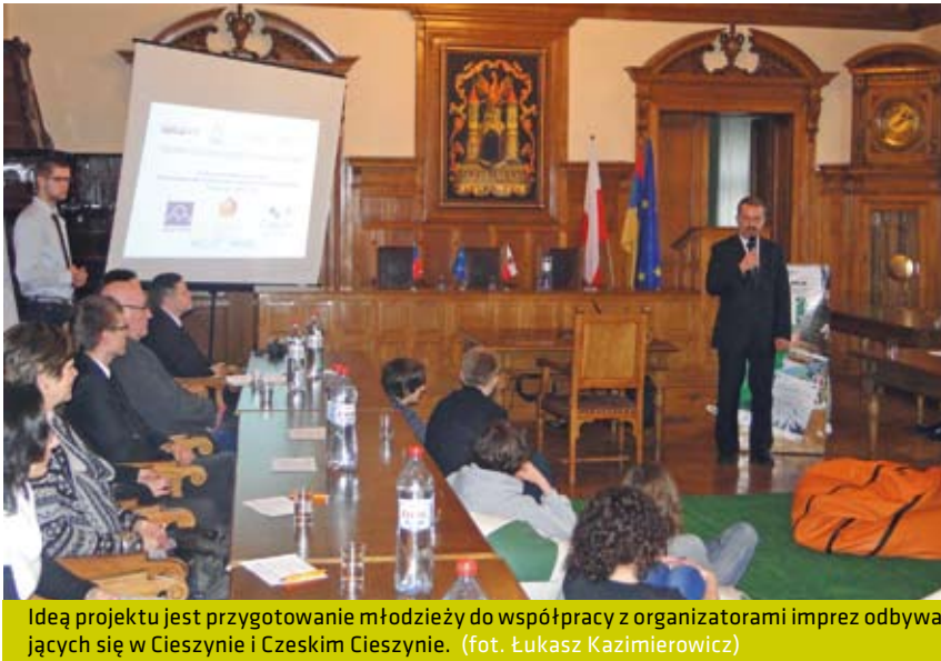
Ideą projektu jest przygotowanie młodzieży do współpracy z organizatorami imprez odbywających się w Cieszynie i Czeskim Cieszynie.

W dniu 2 marca w sali sesyjnej cieszyńskiego ratusza odbyła się konferencja inauguracyjna projektu Transgraniczne Centrum Wolontariatu i Wsparcia Imprez, który dofinansowany jest ze środków Unii Europejskiej w ramach Europejskiego Funduszu Rozwój Regionalnego - Programu Operacyjnego Współpracy Transgranicznej Republika Czeska - Rzeczpospolita Polska 2007 - 2013 i budżetu państwa za pośrednictwem Euroregionu Śląsk Cieszyński. Projekt został przygotowany i jest koordynowany przez Wydział Kultury Urzędu Miejskiego.